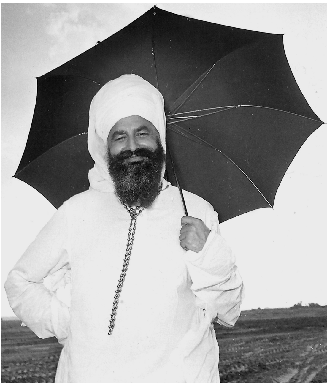
Figure 1: Maharaj Virsa Singh debout dans les champs fraîchement labourés de Gobind Sadan, à l'extérieur de New Delhi, vers 1971.